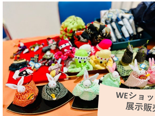
WEショップ・リメイク 展示販売コーナー